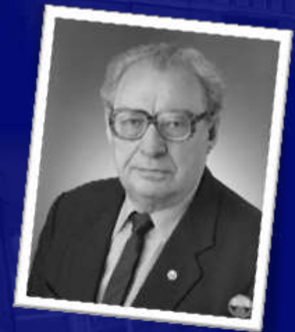
Académicien G.I. Galazii