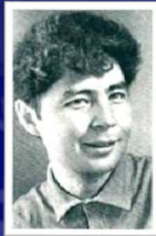
Écrivain dramaturge A.V. Vampilov