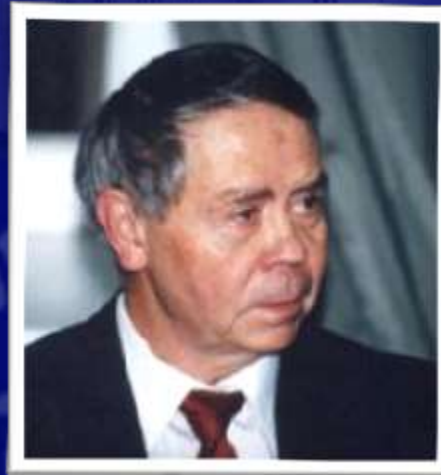
Écrivain V.G. Raspoutin