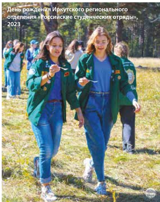
День рождения Иркутского регионального отделения «Российские студенческие отряды», 2023

Февральский выпуск газеты «Иркутский университет» посвящен Дню российских студенческих отрядов. В нашем университете около пятисот студентов ощущают себя частью этой большой и дружной семьи. Публикуем различные фотографии из жизни студотрядов ИГУ. Ищите себя и друзей!