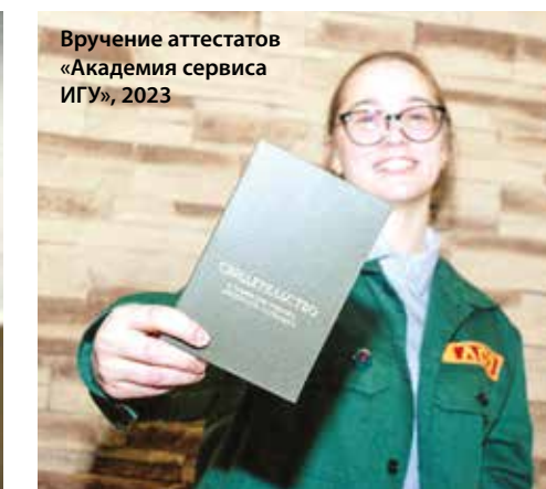
Вручение аттестатов «Академия сервиса ИГУ», 2023