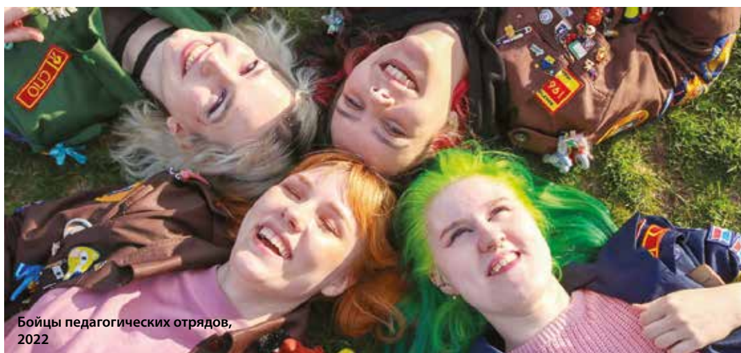
Бойцы педагогических отрядов, 2022