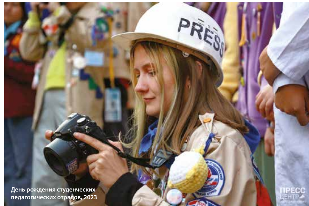
День рождения студенческих педагогических отрядов, 2023