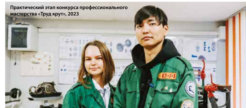
Практический этап конкурса профессионального мастерства «Труд крут», 2023