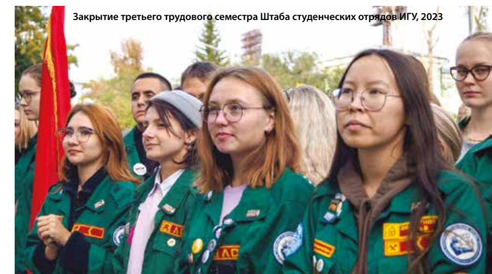
Закрытие третьего трудового семестра Штаба студенческих отрядов ИГУ, 2023