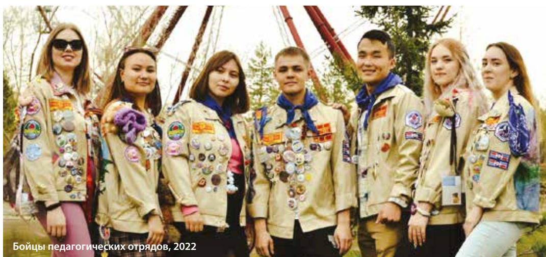
Бойцы педагогических отрядов, 2022