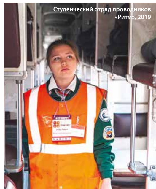
Студенческий отряд проводников «Ритм», 2019