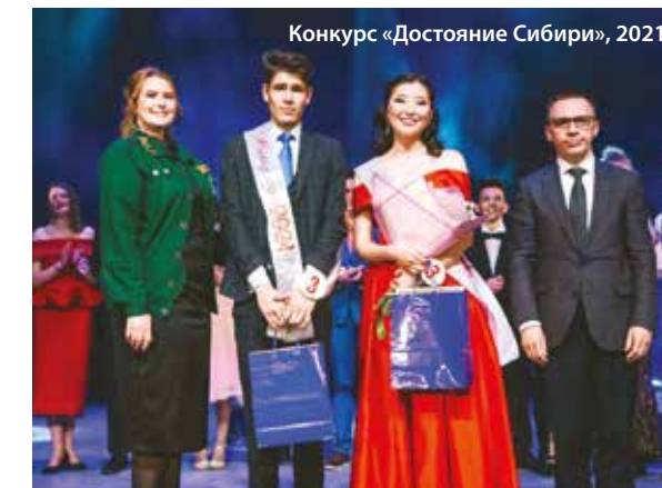
Конкурс «Достоиние Сибири», 2021