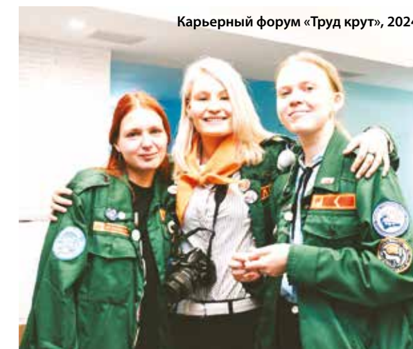
Карьерный форум «Труд крут», 2024