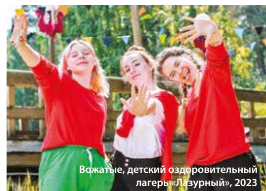
Вожатые, детский оздоровительный лагерь «Лазурный», 2023