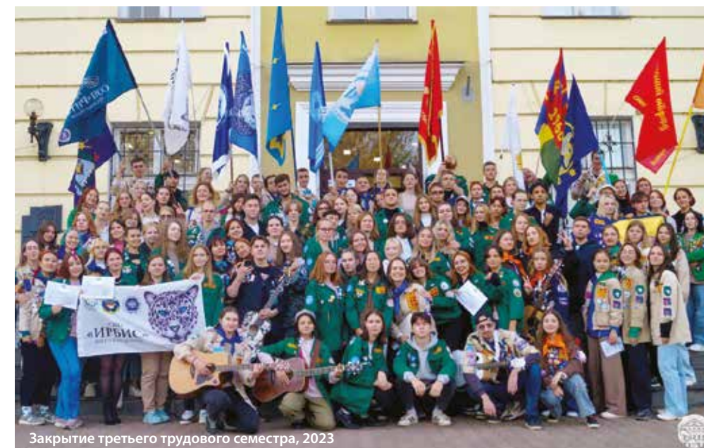
Закрытие третьего трудового семестра, 2023