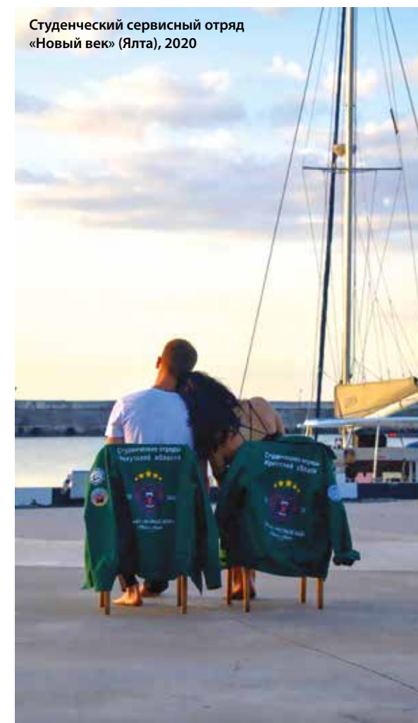
Студенческий сервисный отряд «Новый век» (Ялта), 2020