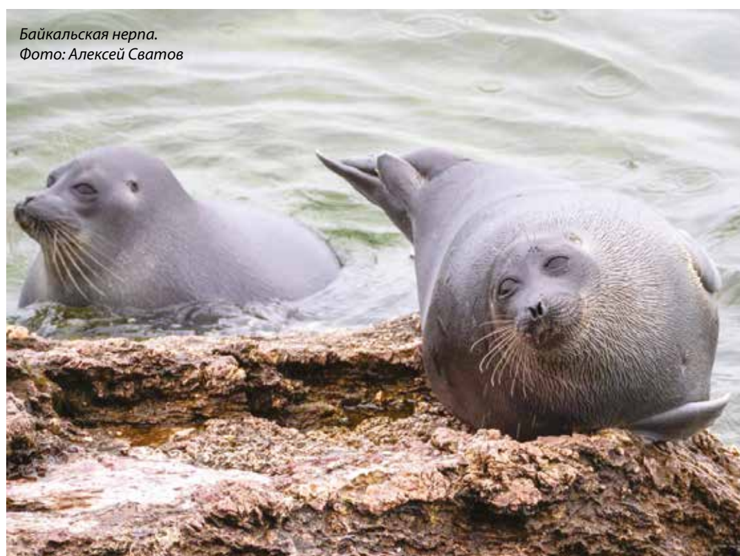
Байкальская нерпа.